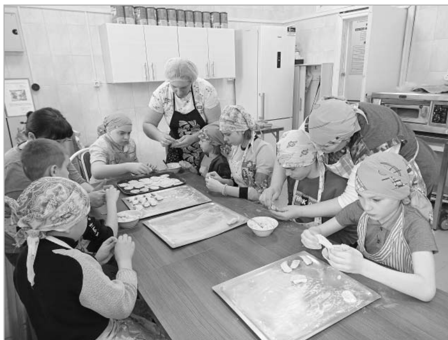
Социально-бытовым навыкам обучают детей с ограниченными возможностями здоровья в жилом модуле «Кухня».

«Занятия в сенсорно-динамическом зале рекомендованы при проблемах двигательной системы, ДЦП легкой формы, аутистических рас-