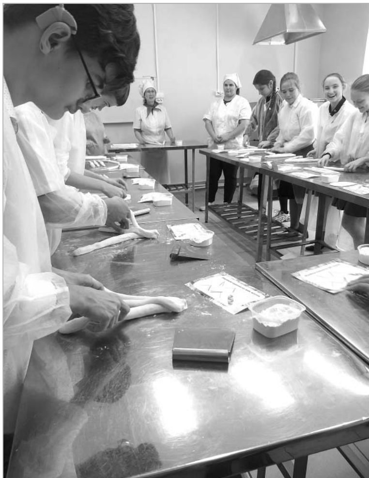
На снимках: в октябре школьники с нарушением слуха из Новоалтайской общеобразовательной школы-интерната познакомились с профессиональными направлениями умной и комфортной среды проекта «Билет в будущее», попробовав себя в качестве пекарей и лаборантов химического анализа. Мероприятие вошло в топ-5 событий «Билета в будущее»-22 на Алтае.

Например, стала более эффективной система тестирования. Сначала ребенок оценивает свои сильные стороны и потенциал для развития, а при повторном тестировании, после знакомства с профессиями, анализирует личностные особенности. «Конструктор будущего» в личном кабинете педагога открывает новые возможности для проведения урока профориентации, опираясь на индивидуальные