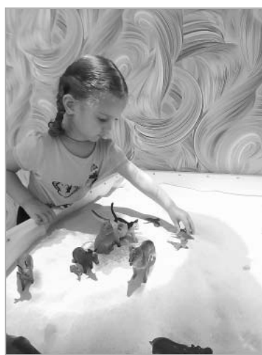
Реабилитационное занятие с использованием интерактивной песочницы (КРЦ «Родник»).