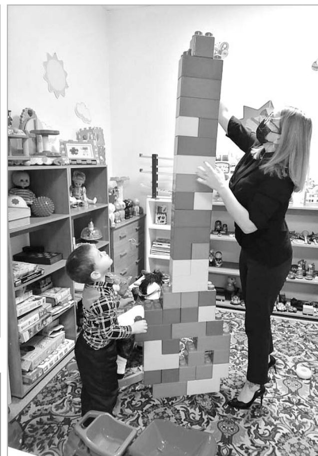
Кабинет реабилитации в Комплексном центре города Славгорода.

Кроме этого, многие семьи получают помощь квалифицированных специалистов в ближайшем