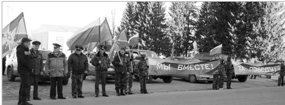
«Мы должны быть вместе. Мы должны быть едины, особенно в трудное для страны время», – считают ветераны локальных войн и вооруженных конфликтов. Именно поэтому они пришли проводить земляков, уходящих в зону СВО.

Еще один момент, который хотел бы пояснить. Возможно, специальная военная операция давно уже закончилась бы, если бы некоторые контрактники не побежали из наших Вооруженных сил. Определенный процент военнослужащих расторгли свой контракт в первый же месяц начала СВО. И я тоже лично знаю таких людей. Наверное, именно из-за них наши Вооруженные силы не смогли в полном объеме и в более короткие сроки выполнить поставленные Генеральным штабом задачи. А ведь они давали присягу, получали хорошее денежное и вещевое довольствие, квартиры, льготы и прочие блага. И вдруг отказались от службы, просто сбежали. Теперь их работу будут выполнять те, кто записался добровольцем или ушел по повестке. Мне обидно до слез, что среди нас есть такие мужчины, которых я