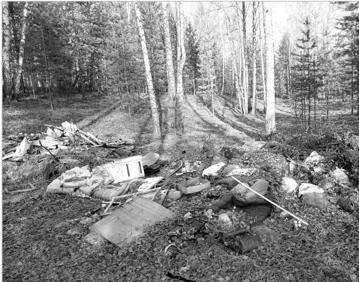
Богата и разнообразна природа нашего района. Но, к сожалению, некоторые наши земляки идут в лес совсем не для того, чтобы насладиться этой красотой. Они выносят и вывозят сюда всевозможные бытовые отходы, поэтому несанкционированные свалки в окрестностях райцентра с каждым днем увеличиваются в своих масштабах.