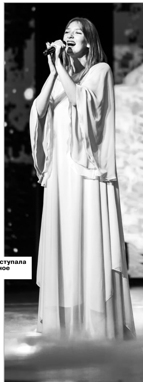
Подготовила Наталья ЗАБОЛОТИНА.

Дельфийские игры – это творческие соревнования молодых деятелей культуры и искусства.