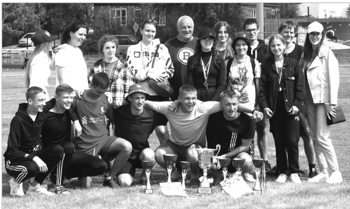
Боровлянская команда – на первом месте среди сельских