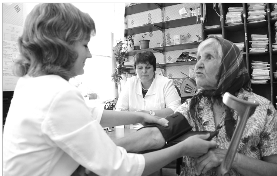
Самые благодарные пациенты – пожилые.

За период с 2019 по 2021 год ежемесячная денежная компенсация оплаты найма жилых помещений была назначена 189 медицинским работникам Алтайского края: 144 врачам и 45 медработникам среднего звена.