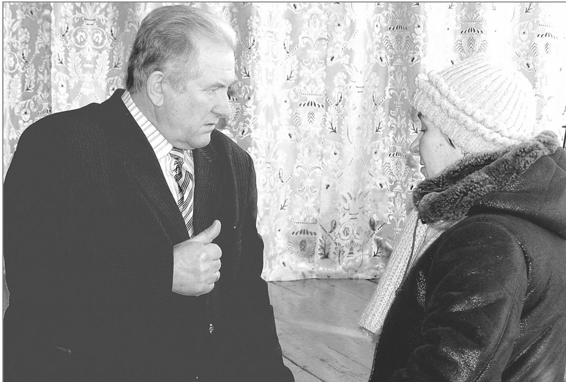
Прием по личным вопросам глава района ведет в администрации каждый третий понедельник. Но, выезжая в села, выслушивает каждого.

Говоря о проблемах животноводства в этом хозяйстве, глава района выделил некоторые из них: некачественная заготовка кормов, кадровая проблема и низкий уровень зарплаты. При этом положение