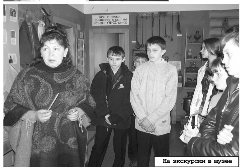
На экскурсии в музее

Еще одна номинация доставила жюри немало хлопот – это конкурс фотографий «Радуга впечат-