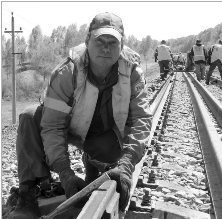
Последний стык, последнее соединение, и новые рельсы на отрезке пути уложены. «Бархатный» путь для движения поездов открыт.

—Из обычных механизмов у нас задействовано три бульдозера и столько же грейдеров, погрузчик, каток для уплотнения земельного полотна. Из специальной техники применяются укладочные краны, дозаторные вертушки, выправочная техника, балластер, выправочно-подбивочная машина, подбивочно-рихтовочная машина, планировщик балласта и много других специальных механизмов и оборудования. Строительные материалы, например, щебеночный балласт, подвозим. Вся применяемая специальная техника и механизмы, шпалы, рельсы и строительные материалы — только отечественного производства.