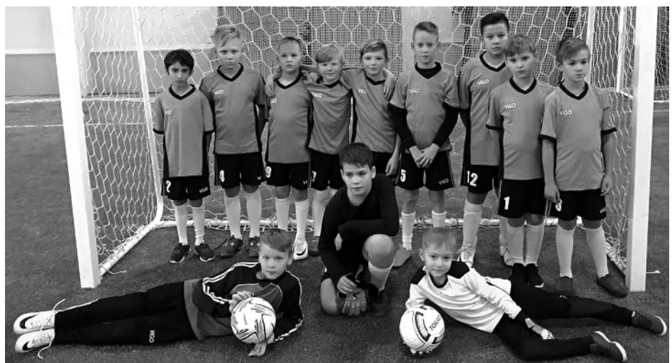
Фото предоставлено отделом по спорту.