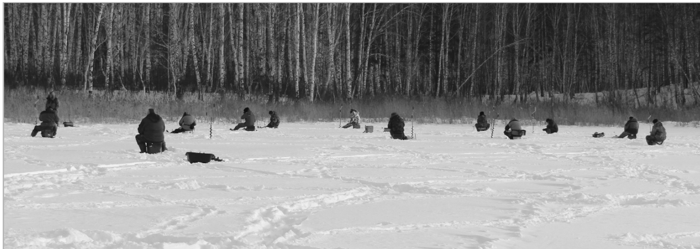
Направление ветра можно определить безошибочно, достаточно только посмотреть, как расселись рыбаковы.

Редакция газеты и отдел по спорту состязания по зимней рыбалке проводят несколько лет подряд. По их итогам формируется команда, которая защищает честь района на краевых соревнованиях, проходящих под эгидой Алтайской федерации рыболовного спорта.