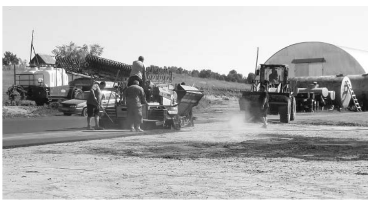
Текст и фото Виктора РЯБОВА.

Кроме дорожных работ наше предприятие занимается различными видами деятельности, в том числе розничной торговлей, грузовыми перевозками на своих автомобилях, а также туристическим бизнесом — у нас имеется своя база отдыха «Жемчужина Уткуля».