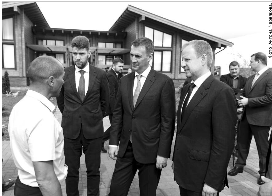
На Дне сибирского поля земледельцы могли напрямую обозначить проблемы отрасли министру сельского хозяйства России Дмитрию Патрушеву (на снимке в центре).

Кроме этого, Патрушев провел на площадке Дня поля оперативный штаб Минсельхоза РФ, где обсуждалась в том числе и поддержка алтайских аграриев.