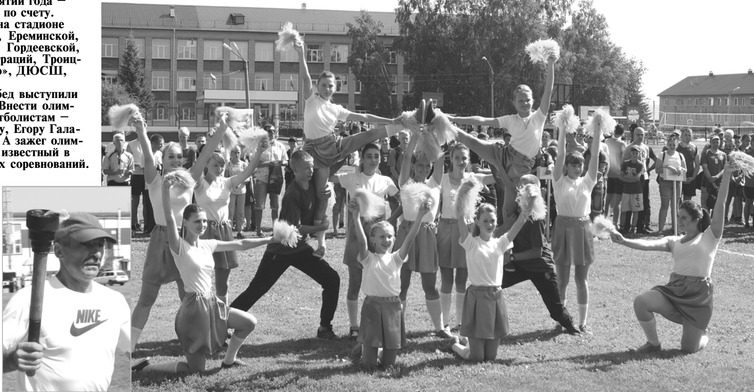
Один из ярких моментов открытия олимпиады: зажигательное выступление танцевального коллектива «Модерн» ТЧШ №2.

— Я всегда с удовольствием приезжаю на такие мероприятия. В первую очередь потому, что ощущаешь стремление победить, адрена-