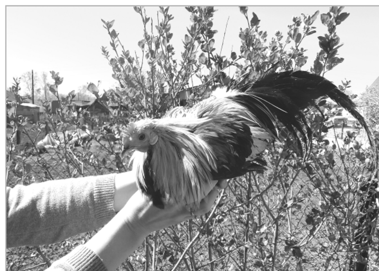
Петух породы феникс покоряет своей красотой.

Когда мы делали семейное фото с голубями под окнами дома, обрамленными ветками черемухи, я подумала, что эта любовь к голубям как бы связала их всех невидимой нитью и будет передавать-