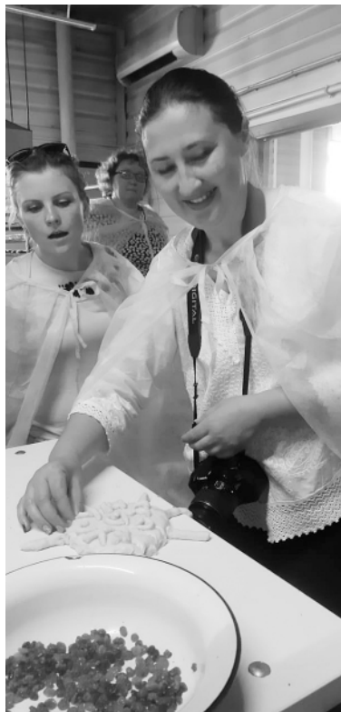
Корреспондентам предоставили возможность изготовить хлебобулочное изделие.

– Сейчас я вижу, что тогда приняла правильное решение, и в планах – расширение производства.