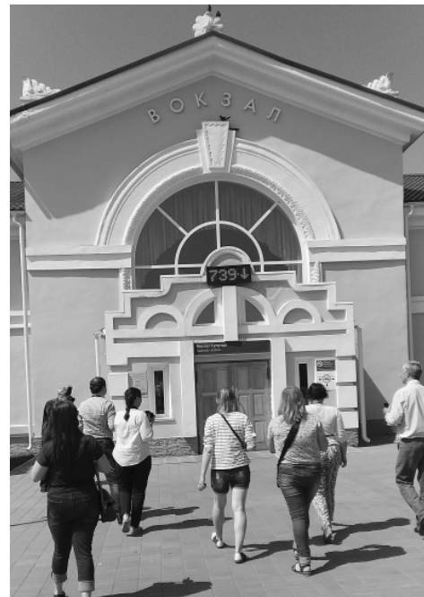
Площадь у железнодорожного вокзала украшает фонтан.

ружи. Три года назад в Кулунде появился 3D-кинотеатр. Его оборудование обошлось в пять миллионов рублей, и два миллиона затратил район на ремонт зала. Кинотеатр востребован, он, один из немногих сельских в крае, работает с плюсом.