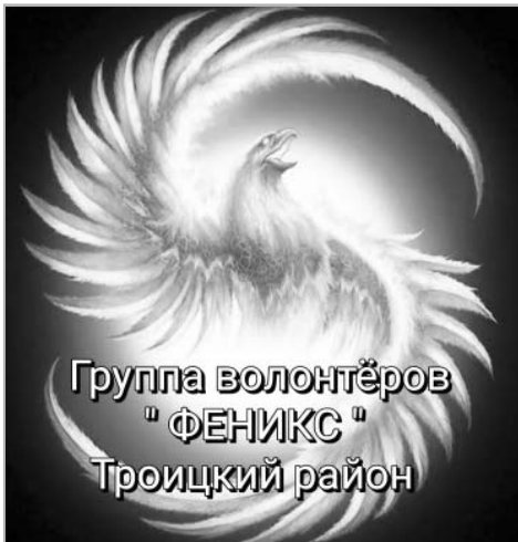
Группа волонтеров "ФЕНИКС" Троицкий район

О деятельности краевого благотворительного фонда «За добро» знают многие, как и о том, что в селах и городах края есть пункты сбора гуманитарной помощи участникам СВО.