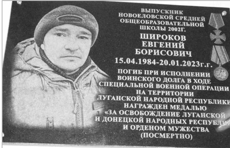
Мемориальная доска в честь нашего земляка установлена в школе, где он учился.