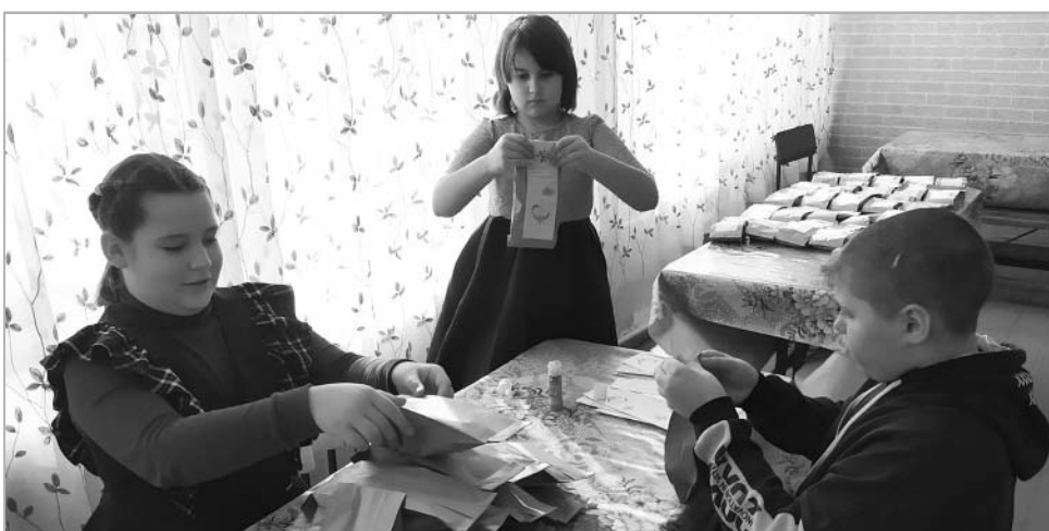
Не отстают от взрослых и ученики Хайрюзовской школы – принимают активное участие в сборе и фасовке продуктовых наборов.