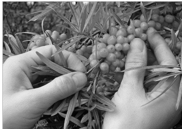
Облепиха в уходе неприхотлива, не боится морозов и грызунов.

По всем этим причинам крупные фермеры не занимаются овощеводством, зато здесь возникает необъятное поле деятельности для мелких производителей в селе. Немного помогает и Минсельхоз. Погектарная поддержка составляет от 12 до 30 тысяч на гектар. Компенсируется 40% цены купленной техники для обработки овощных полей – это, пожалуй, самая осязаемая помощь. Стандартный сельский огород составляет примерно 50 соток. Да и по соседству десятки таких огородов брошены. А каких-то 20 лет назад все эти огороды еще обрабатывались. Как правило, такие небольшие площади можно обработать небольшими тракторами типа Т-25 с прицепными агрегатами и даже мотоблоками. Значительный плюс заключается в том, что огороды эти находятся в черте населенного пункта и там есть водопровод для полива небольших площадей. А если сохранился пруд, есть озерцо или речка, то полив становится еще и дешевым, если купить мотопомпу. Так, например, той же белокачанной капусты со стандартного сельского огорода в 50 соток можно собрать от 35 до 50 тонн, красной столовой свеклы – от 40 до 50 тонн, моркови – от 30 до 40 тонн в зависимости от количества поливов. При сегодняшних ценах сумма от реализации овощей получается внушительная. Если обработать семьей один гектар за сезон, доход получается около миллиона рублей. Осенью 2021 года закупочные цены были такие: капуста – 15 руб-