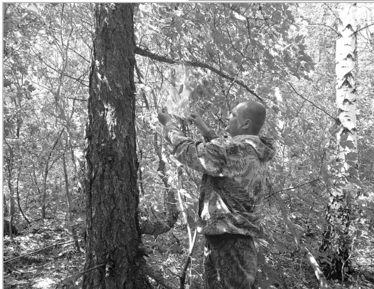
Работники Центра защиты леса развешивают феромонные ловушки на «сибиряка».

Для яйцекладки самки «непарника» летят на открытые прогреваемые солнцем участки и размещают их на коре деревьев, скалах, строениях, заборах, опорах линий электропередач. Яйца непарного шелкопряда будут дозревать всю осень, в это время они очень уязвимы для ранних заморозков и яйцедов. Гусеницы непарного шелкопряда отрождаются ранней