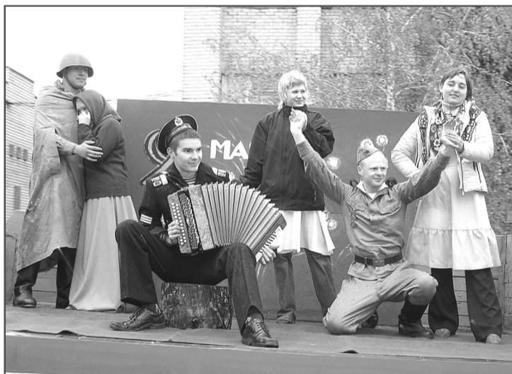
Живые скульптуры возвращают нас в прошлое.

Воевали и мои деды. И обоим забрала война. И так – в каждой семье. Нет участников войны, так есть труженики тыла, блокадники, дети войны. Разве можем мы предать это забвению? И военный парад по телевизору смотрят многие, и поздравляют друг друга, и считают День Победы одним из