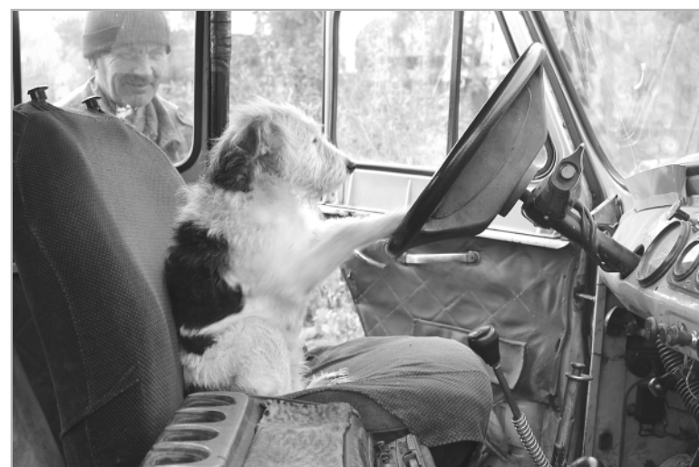
В соседнее село на дискотеку!..

Помните, в прошлом году мы публиковали истории о животных, которые рассказали нам вы, наши читатели?.. Истории были забавные, смешные, даже поучительные и трогательные. А теперь мы хотим предложить вам поучаствовать в нашем конкурсе на самый выразительный фотоснимок вашего домашнего питомца. Попробуйте «поймать» интересные, забавные моменты из жизни ваших домашних животных.