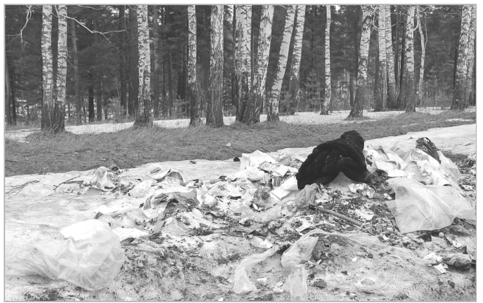
Только и вспомнишь о живописных когда-то окрестностях Троцкого...

детскую площадку, подобную той, что установлена в центре. И в связи с этим обращаемся к жителям села с просьбой внести свои предложения по месту расположения площадки. Предварительно обозначены три: район ПМК, улица Калинина и район маслосырзавода, но ждем новых предложений, и площадка будет установлена там, где, по мнению жителей Троцкого, она будет востребована больше всего. Со своими предложениями жители могут обращаться непосредственно в администрацию сельсовета, могут позвонить по указанному выше телефону или обратиться в редакцию, где все предложения будут зафиксированы и переданы сельсовету.