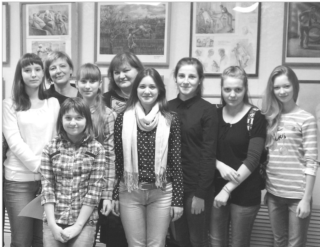
Во время открытия выставки учащихся художественного отделения Троицкой ДШИ в детской картинной галерее «Лукоморье» (г. Барнаул, 2015 год).

— Расскажите, чем вы еще любите заниматься, кроме живописи. — Люблю читать исторические