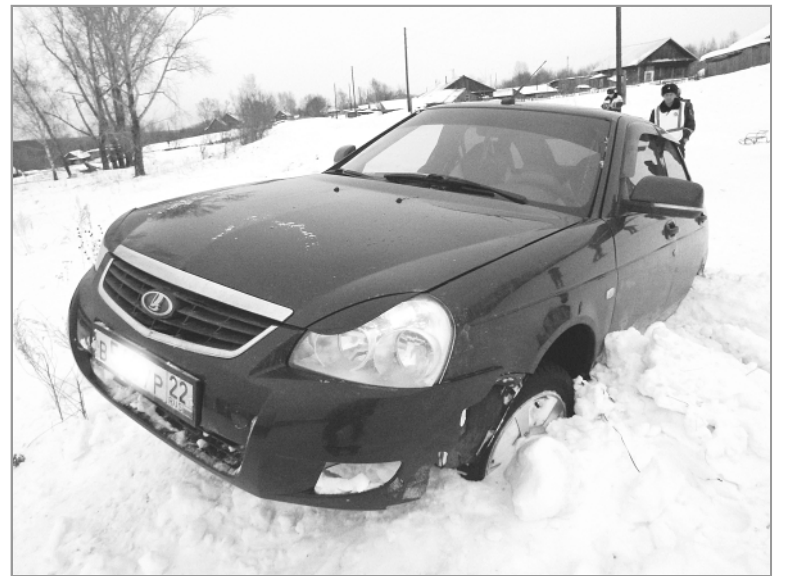
Несмотря на то, что водитель принял экстренные меры, пытаясь избежать наезда и заехав в сугроб, предотвратить дорожное происшествие он не смог.

ЧТОБЫ НЕ БЫЛО БЕДЫ и родители не винули себя за бездействие, чтобы не повторялись подобные случаи, доходчиво разъясните своим детям элементарные правила поведения на проезжей части.