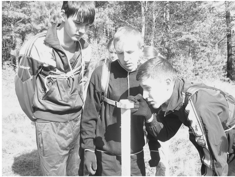
Легко ли определить по компасу, в какой части света ты находишься?

Собралось семь команд: из Беловской №1, Ельцовской, Пролетарской, Беловской основной школы №2, ТСШ №2, Боровлянской и Петровской школ, каждая из которых выбрала себе место, на