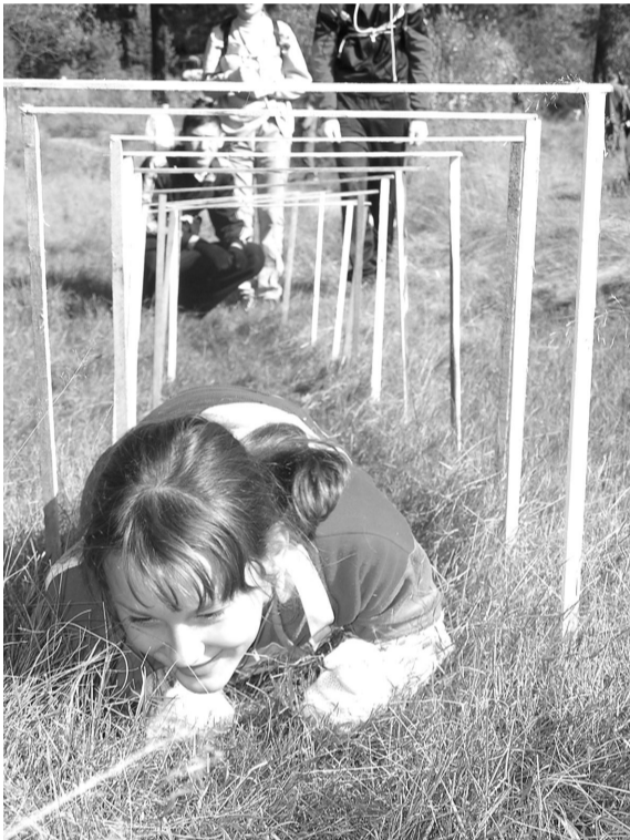
На то она и полоса препятствий, на ней нужно аккуратно проползти мышеловку.

взгляд ребят, самое лучшее для бивуака. Для непосвященных: бивуак – это территория, на которой находится лагерь.