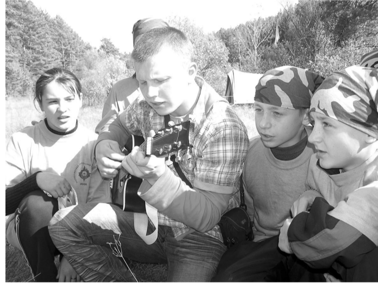
После обеда приятно всей командой спеть песню под гитару, как это сделали пролетарцы.

Пока часть команд, которые в ходе жеребьевки определили очередность, стартовала по туристско-экологической полосе, другие пошли на краеведческую викторину. А жюри тем временем стало выставлять первые баллы за конкурс газет, который назывался «наши строчки в истории Алтая». В оформлении газет учитывались эстетика оформления, информативность и соответствие теме. По итогам конкурса наиболее соответствовала, по мнению жюри, всем заявленным параметрам газета Пролетарской