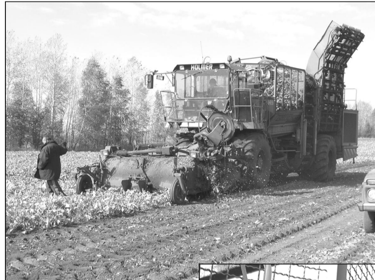
Производительность импортного свеклоуборочного комбайна – 30 гектаров в сутки.

В четырех хозяйствах района, возделывающих сахарную свеклу, началась уборка этой культуры. Мы побывали в двух хозяйствах – ООО «СтандартАгро» и ООО «Паша».