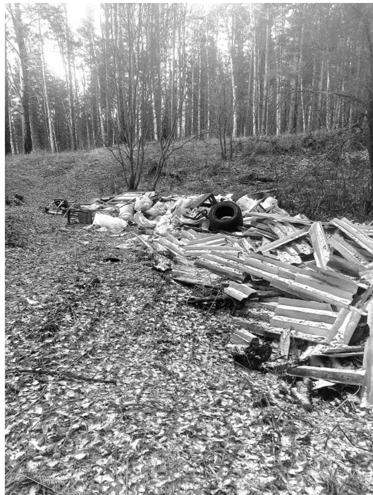
Бряд ли этот мусор на место, где пролегает лыжная трасса, привезли от ремзавода или из-под Тюмени – там и «своих» свалок хватает.

Но при этом хотелось бы обратить внимание всех жителей на другую сторону проблемы, о чем говорят порядочные граждане: соблюдать требования законов по охране окружающей среды и править общезнание необходимо! Так, в федеральном законе «Об охране окружающей среды» сказано: «В соответствии с Конституцией Российской Федерации каждый имеет право на благоприятную окружающую среду, каждый обязан сохранять природу, бережно относиться к природным богатствам». Село, где мы живем, и природа вокруг – это наш дом. Как же можно позволять себе вредить природе, загрязнять отходами потребле-