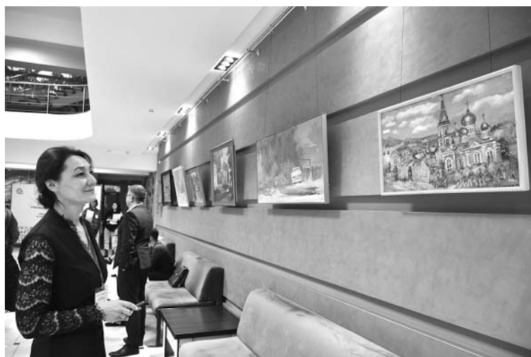
Участники Съезда работников культурно-досуговых учреждений Алтайского края посетили выставку картин художников региона.

ся, что работа Центра будет осуществляться по нескольким направлениям. Кроме деятельности казачьего ансамбля «Станица» будет создана мини-экспозиция «Из истории казачьего быта», организована работа краеведческого клуба