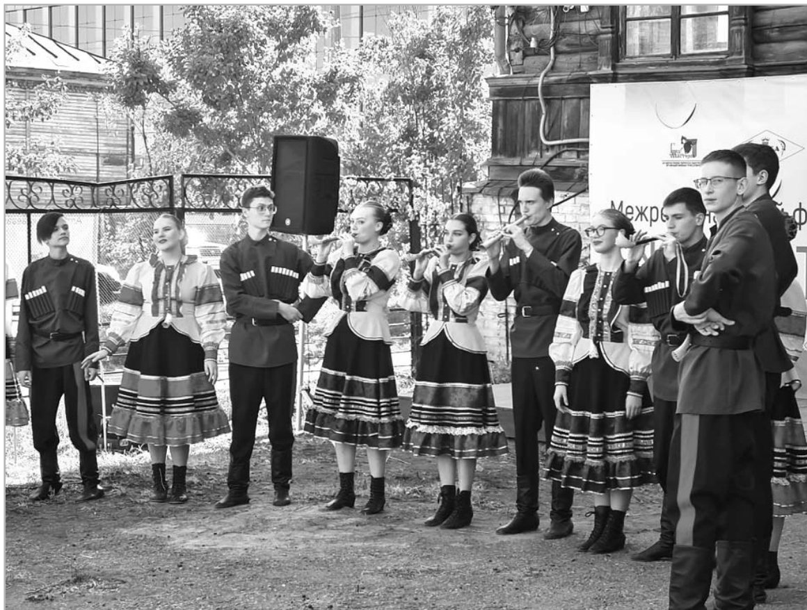
На творческой площадке фестиваля народных ремесел «Живи, традиция!» наряду с другими коллективами с концертной программой выступил ансамбль «Жалейка» (г. Барнаул)

В Год культурного наследия народов России в Алтайском крае будет создан еще один центр традиционной народной культуры. По итогам конкурса победителем признана заявка от администрации Кытмановского района края. До конца 2022 года на базе Кытмановского районного Дома культуры будет создан Центр казачьей культуры «Багатица». Планирует-