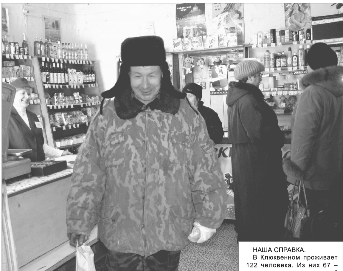
Место встречи клюквенцев – магазин.

Клюквенцы поговорили о проблемах, обсудили предстоящие выборы, сделали покупки и разош-