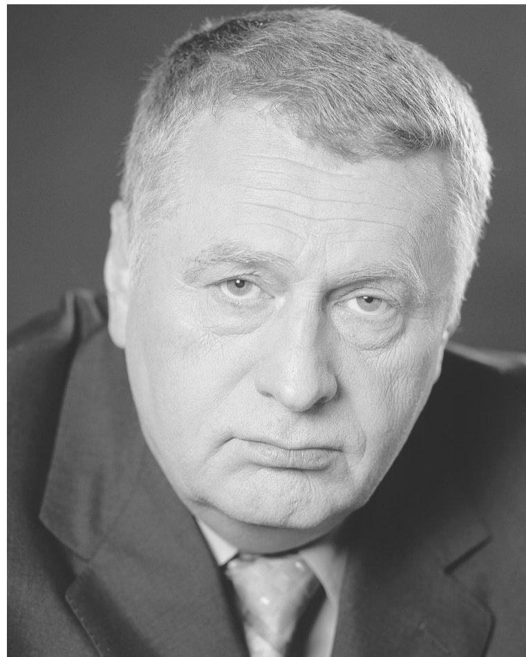
Владимир ЖИРИНОВСКИЙ - № 1 в списке ЛДПР на выборах краевого Законодательного Собрания 2 марта.

- Инфляция в Алтайском крае в 2007 году была выше, чем в соседних регионах. Прокормить на эти деньги семью, проучить детей, вылечить больных родителей! Мы посмотрим, как у них это получится!