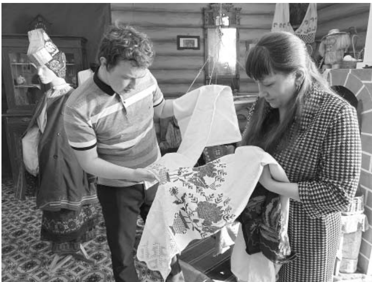
Барнаульские гости с интересом рассматривали варианты вышивки на предметах домашнего обихода.