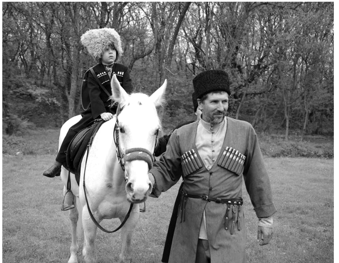
Казачьи семейные традиции наполнены обрядами и ритуалами приобщения ребенка к образу жизни предков.

Казак с рождения и до глубокой старости воспитывался в духе самопожертвования, готов был отдать жизнь за «веру, царя и Отечество». Семья, социальная среда, государственные институты оказывали целенаправленное воздействие на становление личности казака, формируя идеал человека: труженник, семьянин, воин, гражданин. Всем укладом своей жизни казаки стремились воспитывать в детях чувство долга перед семьей и Отечеством, уважение к старшему и ближнему, отвращение к злу и неправде. Детей с малолетства учили радоваться удачам, достойно пре-