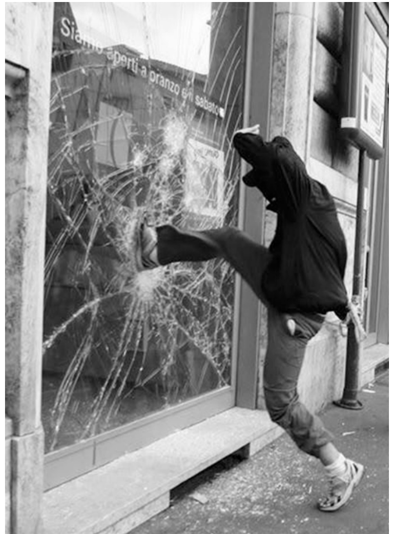
С помощью агрессивных выходок дети всего лишь определяют для себя границы дозволенного.

И вот еще несколько высказываний на этот счет: «Ребенок может быть жестоким и бездушным еще и от страха (чаще всего). Когда ребенок растет в «нехорошем» районе, в жесткой школе. Помочь все равно никому не можешь, вокруг сплошной ад, самому бы выжить. Есть такие места, где ребенок просто выживает. Вот и