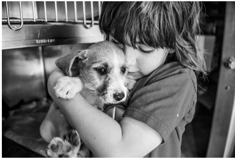
Дети, выросшие в одном доме с братьями меньшими, становятся более добрыми и отзывчивыми.

Неосознанная жестокость появляется в раннем детстве.