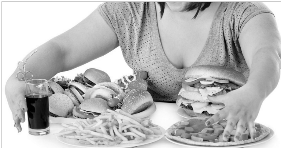
Очень вкусное! Страшно бесполезное...

Для решения вопроса с запретом трансжиров и исполнением принятых норм России и странам ЕЭС необходимо больше лабораторий и нужно иметь единый метод измерения этих жиров. Еще важно распространить применение существующих норм на сферу общественного питания и расширить лабораторные возможности определения трансжиров. Их запрет – это реальная мера снижения смертности от самых серьезных хронических заболеваний».