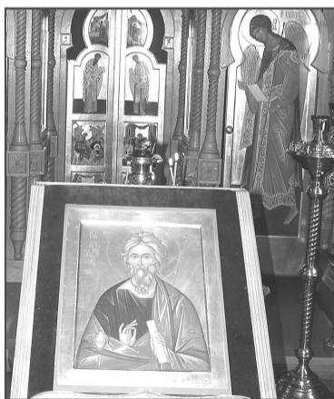
Икона апостола Андрея Первозванного с частичками его мощей.

В России всего два передвижных железнодорожных храма-вагона: один - в Новосибирске, второй -