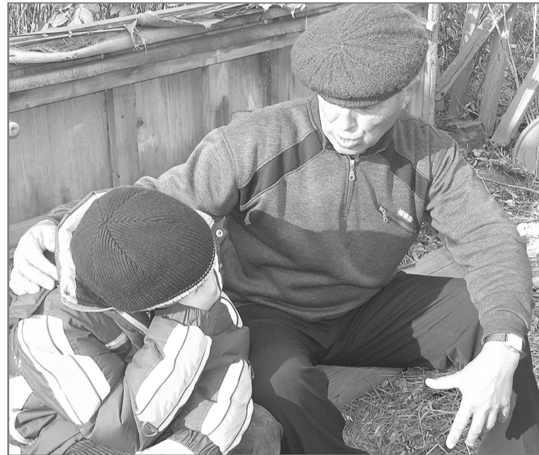
Дед знает много интересных историй – не переслушаешь! С ним можно ходить на рыбалку, починить велосипед. У него можно гостить хоть все лето. Только заменить папу и маму он не сможет...

ПОЛОЖЕНИЕ В НЕКОТОРЫХ СЕМЬЯХ , которые посетила в тот день комиссия, просто шокирует. Например, в одной из них пьющие родители. Девочки 14 и 15 лет сами зарабатывали себе на пропитание сбором грибов-ягод. А когда не успевали потратить деньги на одежду или еду, мама с папой их попросту пропивали. И даже в день приезда комиссии горе-мамаша умудрилась напиться. Было решено забрать девочек в приют. Скорее