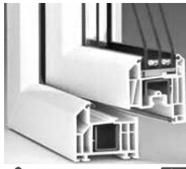
THYSSEN POLYMER Member of the Deceuninck Group

изготавливает высококачественные окна и двери из 5- и 3-камерных немецких профилей «Тиссан фаворит» и «Тиссан Баутек» (ширина 71 мм). Стеклопакет шириной до 40 мм (тройное и двойное остекление).