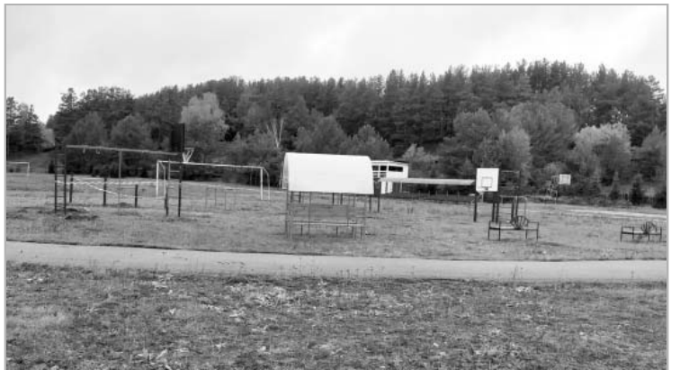
...и спортивные снаряды.

НАЗВАНИЕ ПРОЕКТА говорит само за себя. Стадион, существующий с 1985 года, давно требовал ремонта. Обветшавшие трибуны, на беседках прохудились крыши, и ограждение требовало обновления. В прошлом году администрация сельсовета подала заявку на участие в программе поддержки местных инициатив и вошла в число победителей.