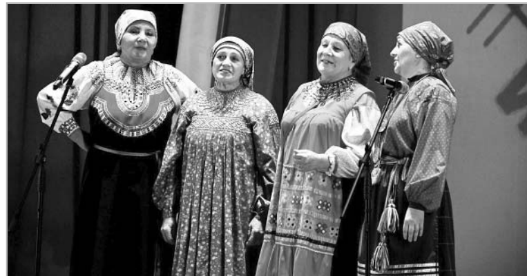
Народный ансамбль «Большеречье» — коллектив, известный и в Троицком районе, и в крае.

на Ляшенко — специалисты Алтайского государственного Дома народного творчества.