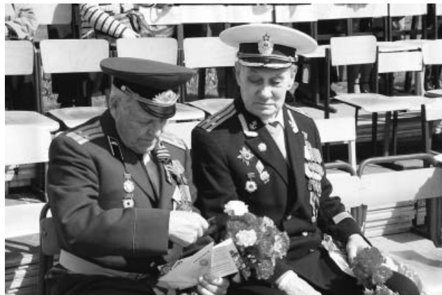
С 1 октября увеличивается размер военных пенсий.

Штрафы за неявку в военкомат, новые послабления и условия в получении гражданства и ужесточение регулирования выдачи ипотеки. Рассказываем о нововведениях, которые ожидают россиян в октябре 2023 года.