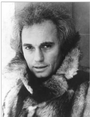
Исполнитель песни «Осенний свет» Жан Татлян (род. 1 августа 1943 года) – советский, французский и российский эстрадный певец. В 1971 году артист уехал в Париж.

– Ну, давай, я буду дуть вот в эту трубочку, а ты слушай, булькает ли в баке.