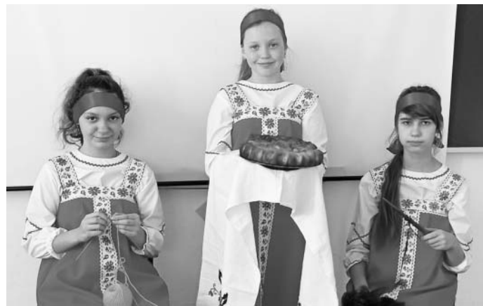
Ельцовские команды «Аленушки».

Троицкий ДЮЦ придумал, как восстановить потерянную связь, и воплотил в жизнь проект «Добрый молодцам урок». Благодаря проекту современные школьники погрузились в мир сказки, которую воссоздал в своих фильмах один из самых известных кинорежиссеров-сказочников советского времени — Александр Артурович Роу.