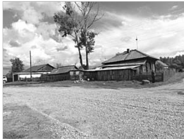
В сентябре на средства районного дорожного фонда в сумме 200 тысяч рублей был проведен ямочный ремонт дороги в селе Тюмень. Щебнем отсыпали дорогу протяженностью 700 метров от дома досуга до детского сада. Работы выполнило предприятие А.Э. Аветяна.

В рамках текущего содержания летом не единожды грейдировались дороги в населенных пунктах – это традиционный вид работ. Иногда