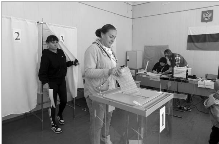
Голосование на участке в ТЦШ №1.

– Считаю, что трехдневное голосование – это хорошо, особенно для тех, кто работает в поле, ведь механизаторам дорог каждый день и час, и они могут выбрать удобное для себя время, – сказал Михаил Иванович. – Но главное – то, как будет относиться к делу избранный губернатор. Люди голосуют за то, чтобы он сделал много