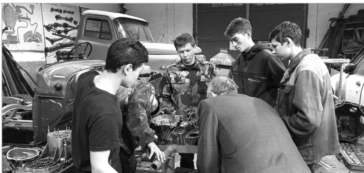
Члены клуба «Автоэксперт» на занятии по разборке-сборке коробки передач ВАЗ-2109.

В нашем кружке приняты за правило взаимовыручка, взаимопони-