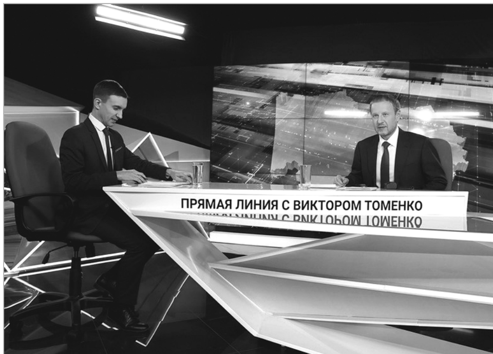
На прозвучавшие во время «прямой линии» обращения и собранные в течение нескольких недель вопросы глава региона отвечал более двух часов сорока минут.