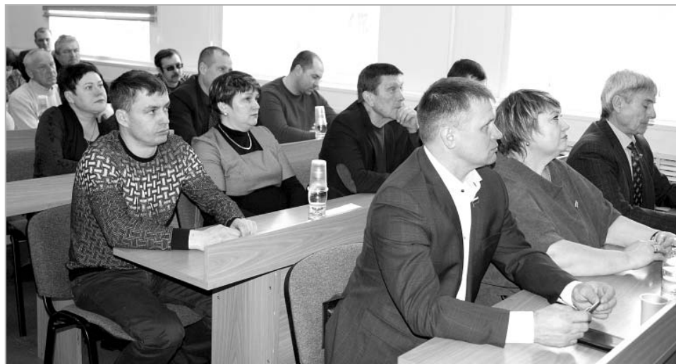
Депутатам, которые работают в законодательном органе не первый созыв, процедура избрания главы района хорошо знакома.

Елена ЦЫГЕЛЬНАЯ.