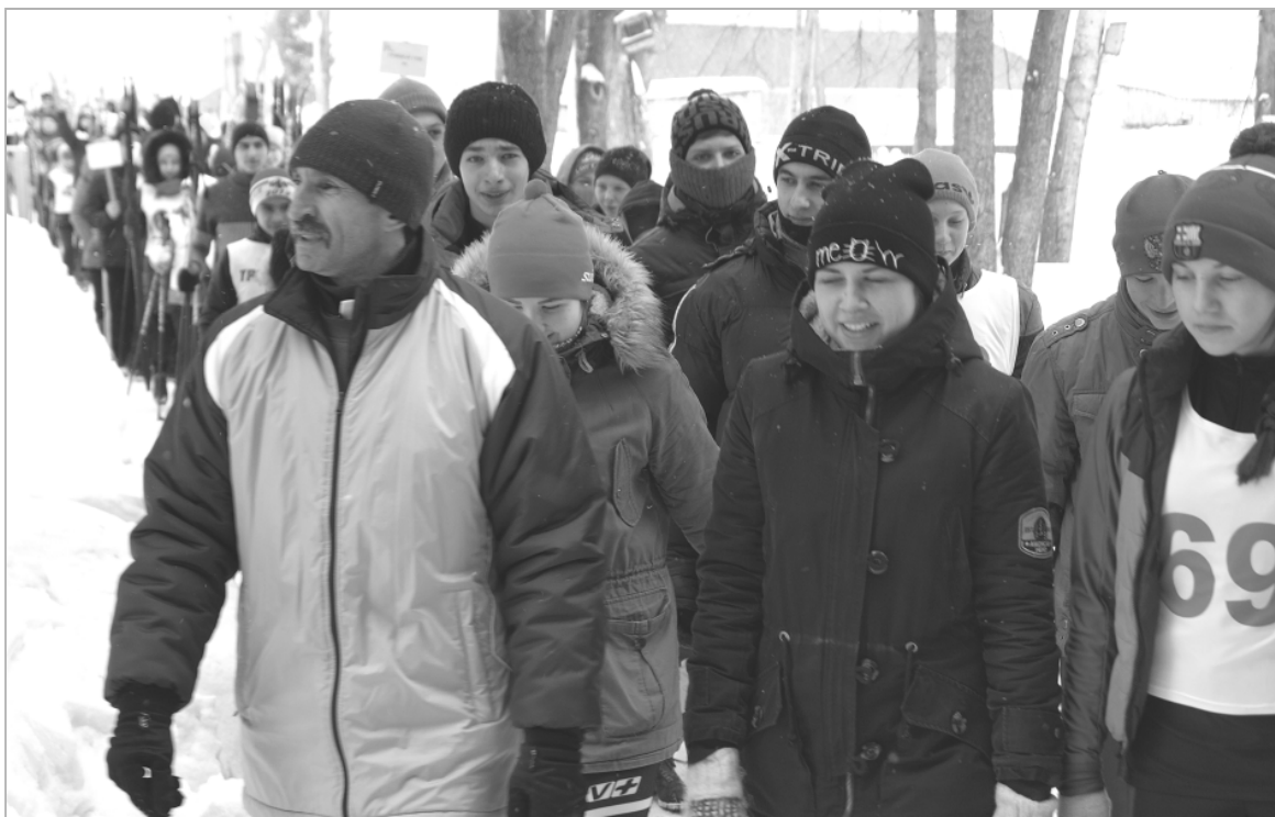
С хорошим настроением выходили на построение перед стартами участники лыжных гонок.

Азарта спортсменам было не занимать. В ожидании старта ребята с удовольствием общались, ведь многие ученики разных школ зна-