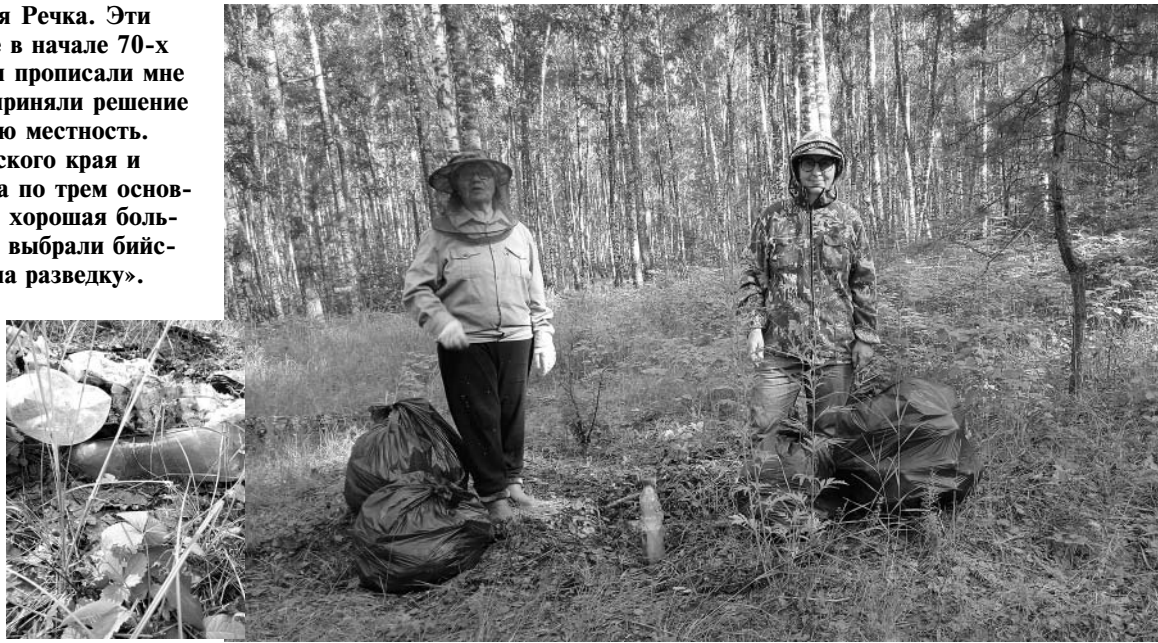
И один в поле воин, а двое и подавно! В результате мини-субботника, проведенного в окрестностях психоневрологического интерната, было собрано и вывезено восемь мешков мусора.

Все годы моей жизни в Троицком наполнены общением с природой. Березовые рощи и земляничные поляны, заросли черной смородины по берегам реки и высокого папоротника, в которых летом прятались маленькие зайчата. С весны до осени лес радовал нас цветами: мы собирали на пригорках целые букеты подснежников, и они каждый год расцветали вновь. На смену подснежникам приходили жаркие огоньки, душистая черемуха, желто-белые солнышки ромашек. А каких только не было здесь грибов! За ними ходили с большими ведрами, спугивая заметно подросших за лето зайцев. Утомившись за время долгого хождения по лесу, можно было упасть в душистую траву, смотреть в синее небо и слушать стрекот кузнечиков. Особенно мне нравились черные кузнечики с красными крыльями, они перелетали на большие расстояния с оглушительным трес-