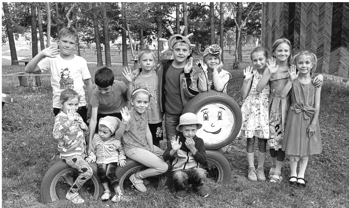
Больше всех была рада празднику местная детвора.

Место проведения мероприятия выбрано неслучайно, ведь Озеро-Петровское славится не только своими традициями и гостеприимством, но и большим количеством многодетных семей. В этом небольшом селе проживает 16 семей, вос-