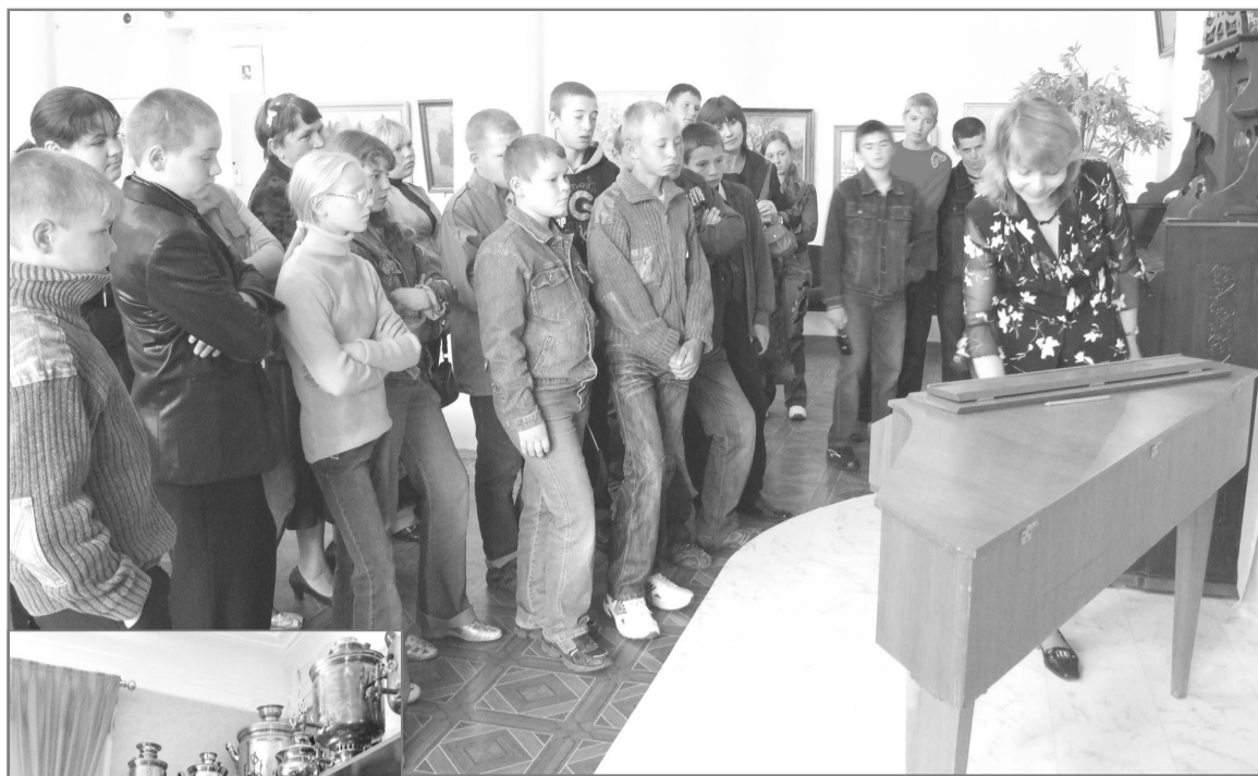
Не только увидеть, но и услышать, как звучит клавишник!

Вот зал, где немало репродукций картин известного путешественника, философа, художника Николая Рериха. На одной из стен под рам-