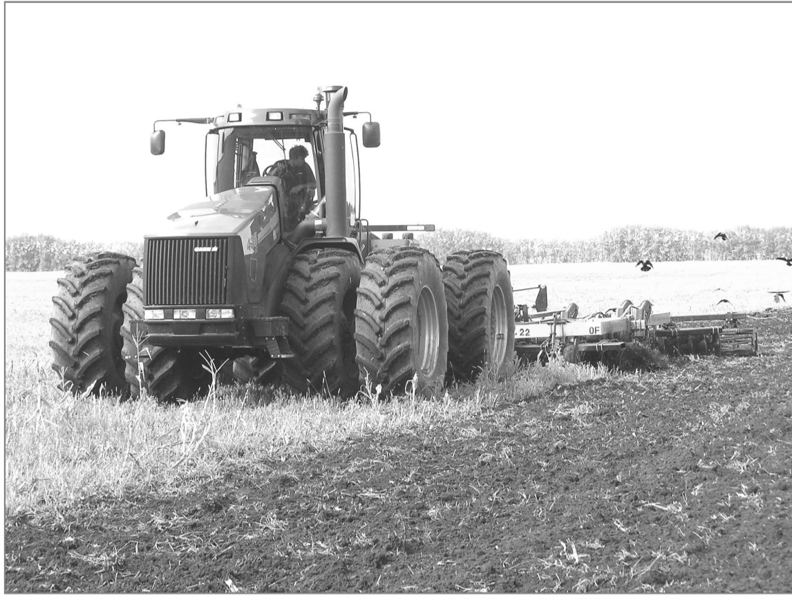
В ПСХ «Заводское» нынче готовят зябь импортным трактором «Кейс-435», приобретенным по краевой программе «Техническое перевооружение» в рамках нацпроекта «Развитие АПК».