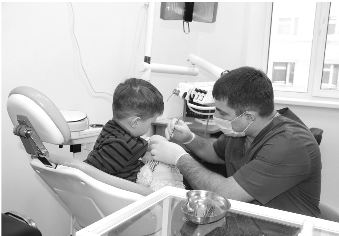
В поликлиниках края создают комфортные условия для маленьких пациентов.

При выписке из кардиологических отделений Краевой клинической больницы и кардиодиспансера одновременно с выпиской региональные и федеральные льготники получают рецепты на лекарственные препараты базовой терапии и набор препаратов по ним на один месяц. По истечении месяца пациенты для продолжения лечения обращаются для осмотра и выписки рецептов в поликлинику к участковому терапевту, у которого уже есть информация о