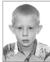
мальчика – 17 кг, рост – 112 см, глаза светло-зеленые, волосы светло-русые.