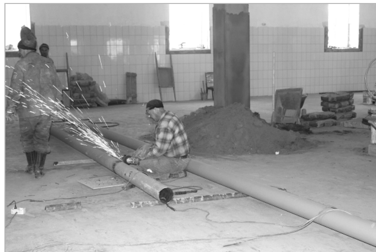
«Троицкий МСД»: через несколько месяцев здесь вновь будут делать сыры, а пока в ход идут сварка и «болгарка».