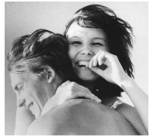
Фото из открытых источников (серия «Романтика советской эпохи»).

На стройке пожилой бригадир Семенчик ушел на пенсию, и все заботы о работе бри-