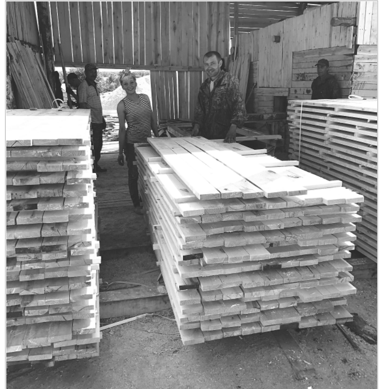
В планах барнаульского предпринимателя — глубокая переработка леса.

— Наверное, так диктуют рынок и развитие страны в целом. Раньше продавали за рубеж только лес-