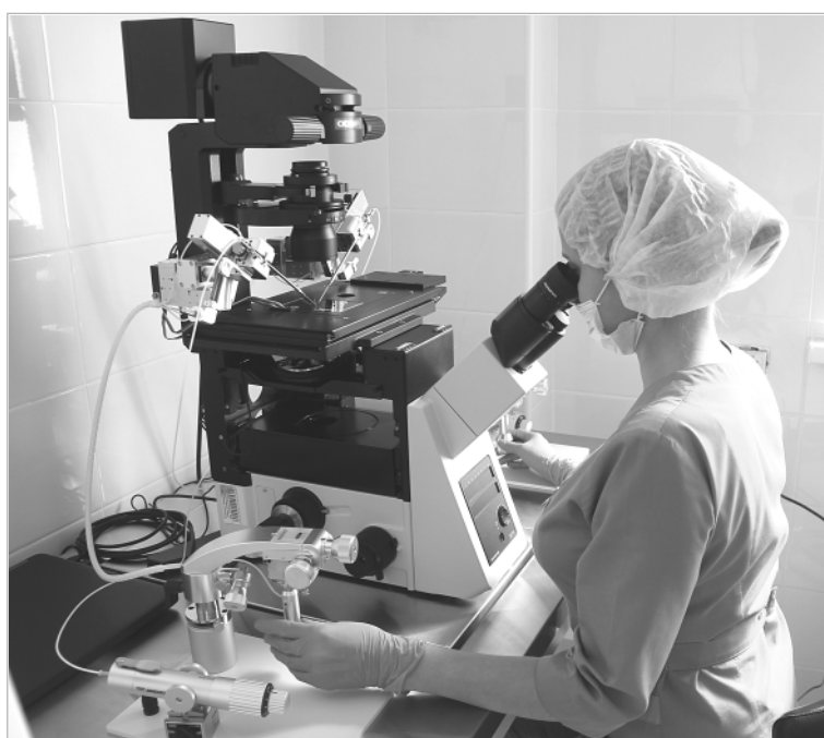
Открытая в Центре «ДАР» лаборатория оснащена пятнадцатью единицами уникального, самого современного оборудования. Большинство проводимых методик и их интерпретация во всем мире являются новым направлением в решении вопросов восстановления функции эндометрия.

С целью решения данной проблемы в «ДАРе» создан регистр бесплодных пар, содержащий сведения о пациентах с бесплодием, поставленных на диспансерный учет в поликлиниках по месту жительства. Четыре акушера-гинеколога Краевого центра охраны семьи и репродукции имеют связь с каждым специалистом первичного звена, активно консультируют последних в выборе оптимального объема обследования и лечения. Главная же их задача — не упус-