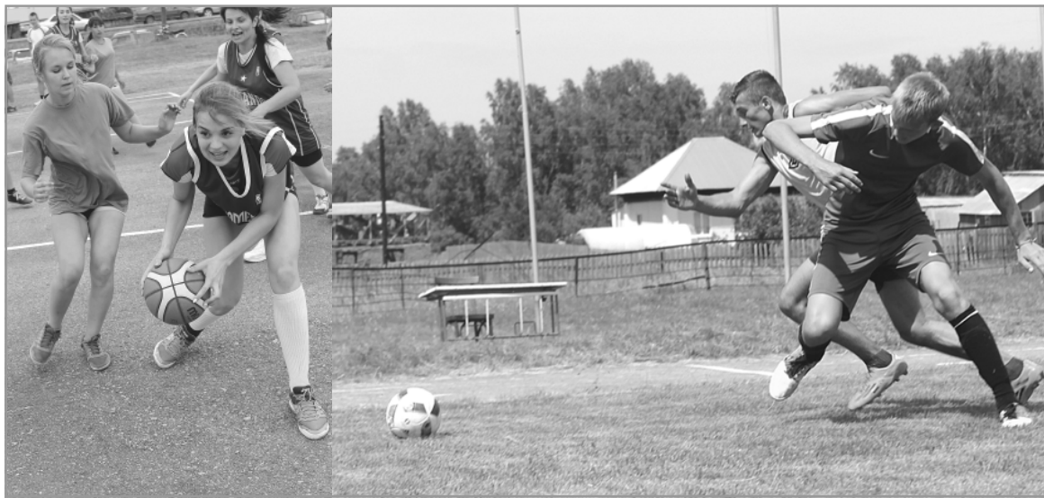
Во всех видах спорта на районных олимпиадах участники соревнований выкладываются по полной. Здесь все по-настоящему — и радость побед, и горечь поражений...