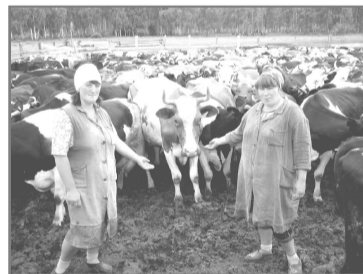
Доярки ПХ «Троицкое» помогают выбрать из стада самую спокойную буренку.