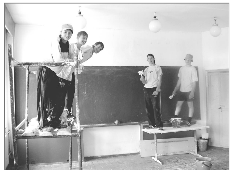
Когда повкальываешь на ремонте учебных кабинетов, вряд ли захочется оставить следы от кроссовок на потолке...

– Ребята настолько увлекаются работой с цветами, что иногда даже не могут их остановить, – говорит Л.В. Турлова, которая руководит цветоводами и огородниками