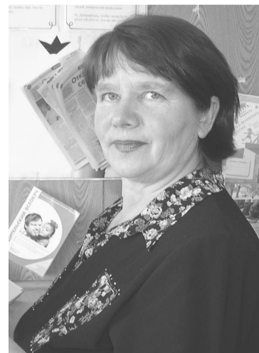
Ирина Иосифовна помнит, как родители периодически ходили отмечаться к участковым:

Боровлянку, по дороге у них укрывали весь багаж. Приехали в поселок с пустыми руками. Построили землянку, в которой и родилась старшая сестра. Отец говорил, что она выросла на лебедь да крапиве. Вскоре построили дом. Мать всю жизнь работала патронажной сестрой. Отец – на живичном складе, а потом до пенсии – продавцом ОРСа.