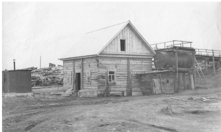
Так выглядела заправочная станция в Боровлянке в 1960 г.

С использованием архивных материалов подготовила Наталья ЗАВОЛОТИНА.