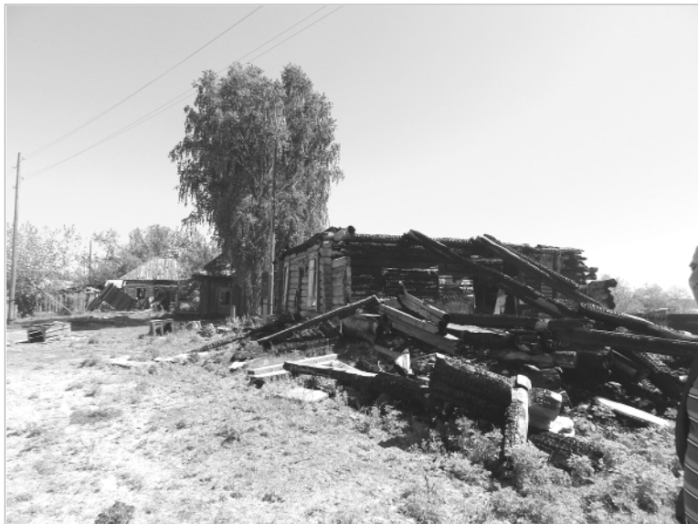
Одна из актуальных проблем Озеро-Петровского — это брошенные дома. Бывшие владельцы, наверное, еще не слышали, что существует закон, обязывающий их навести порядок на собственной территории, и именно этот закон собираются применить к нерадивым хозяевам местные активисты.