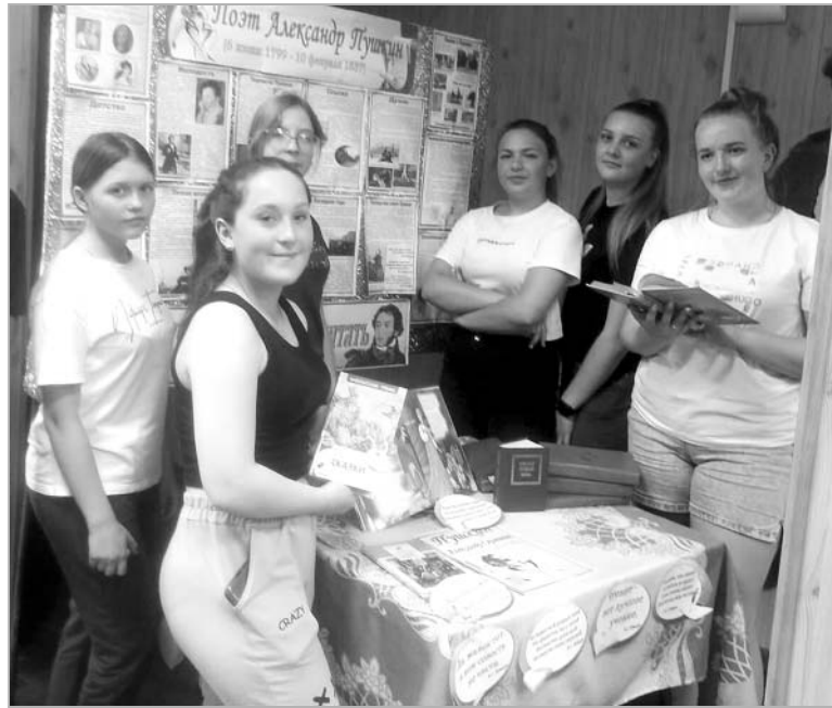
Грантовые средства работают на благо сельских ребят и молодежи!

Летом в гости к бабушкам и дедушкам приезжает много детей, они приходят к нам в Дом культуры, и мы можем предложить им