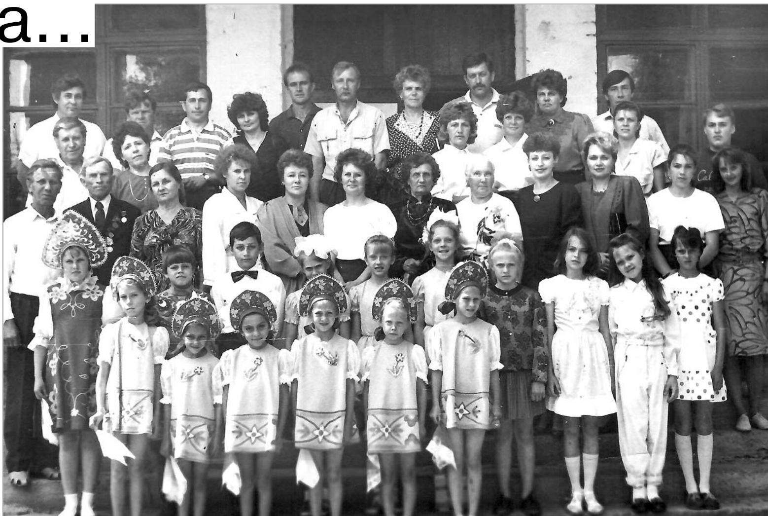
20 лет спустя... На фото 1993 года — учителя и выпускники 73-го с легендарной агиттачанкой «Соколенок».

В этом году, уже совсем скоро, состоится совместный вечер встречи выпускников обеих троицких школ.