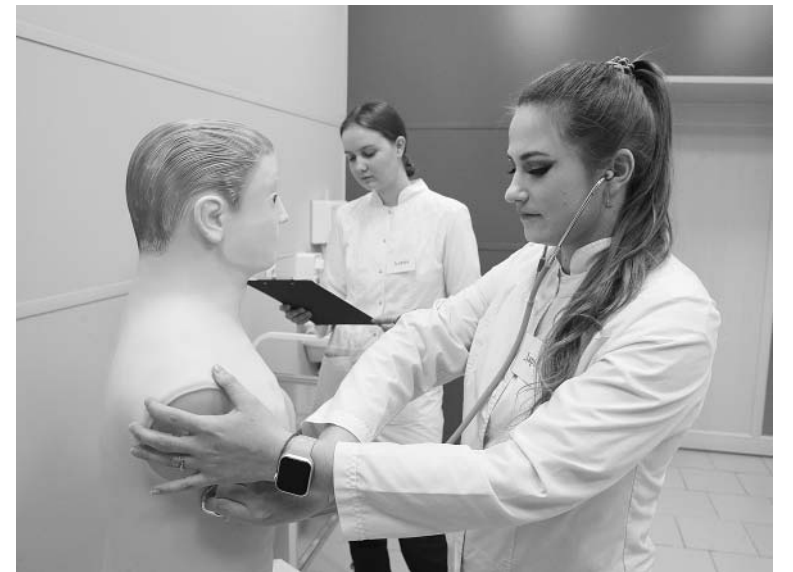
В Барнаульском медколледже во время посещения его губернатором.

«Для работы я выбрала ЦРБ в селе Павловск. Сегодня получила диплом, осталась аккредитация, потом приступлю к работе. Я уже была в павловской больнице как волонтер, там сделан хороший ремонт. Сельскую местность выбрала потому, что планирую воспользоваться материальной поддержкой по программе «Сельский фельдшер», также будут ежемесячные доплаты как молодому специали-