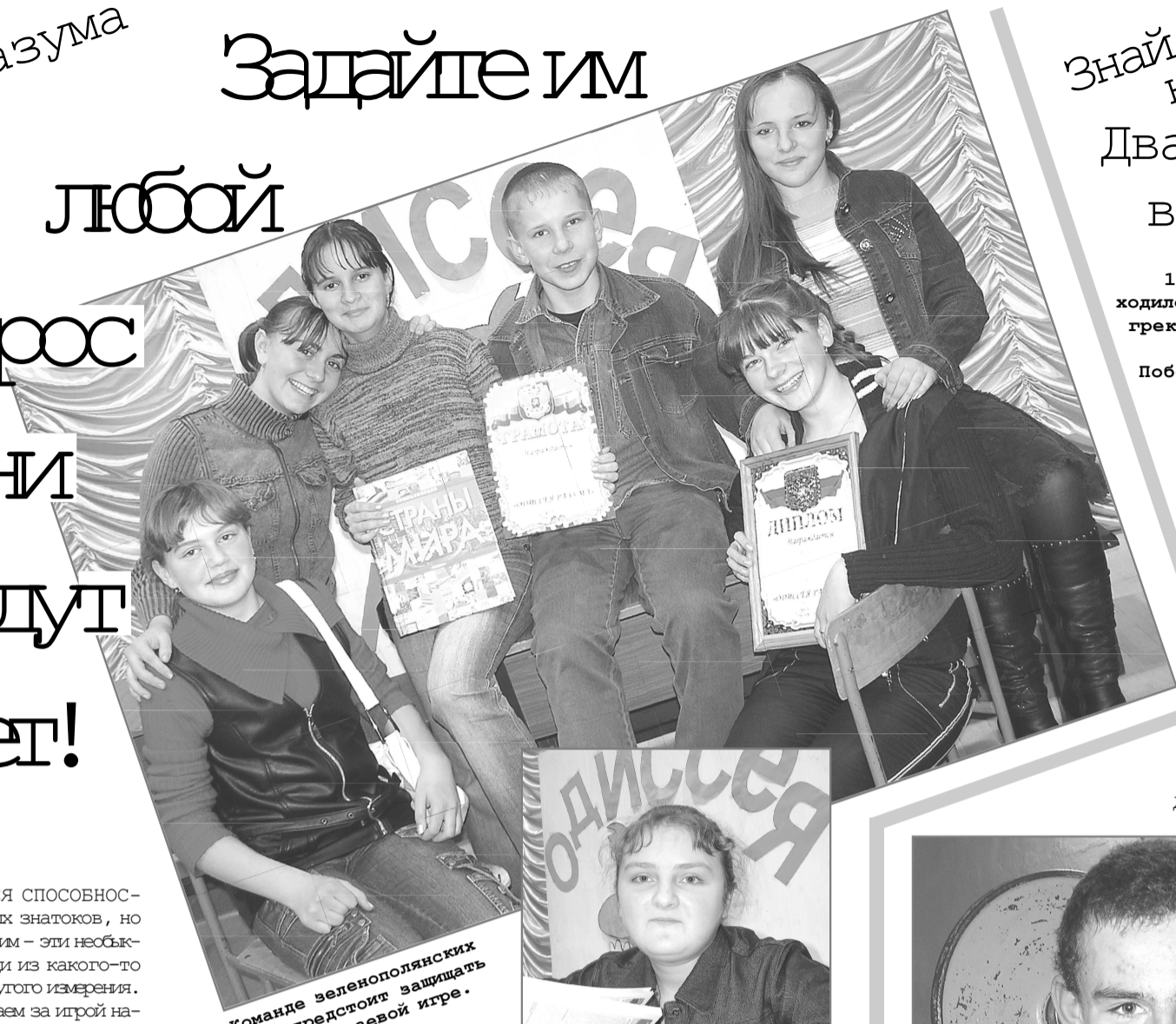
Команда зеленополянских эрудитов предстает защищать честь района в краевой игре.