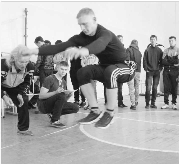
Настоящий азарт вызвали прыжки в длину с места.