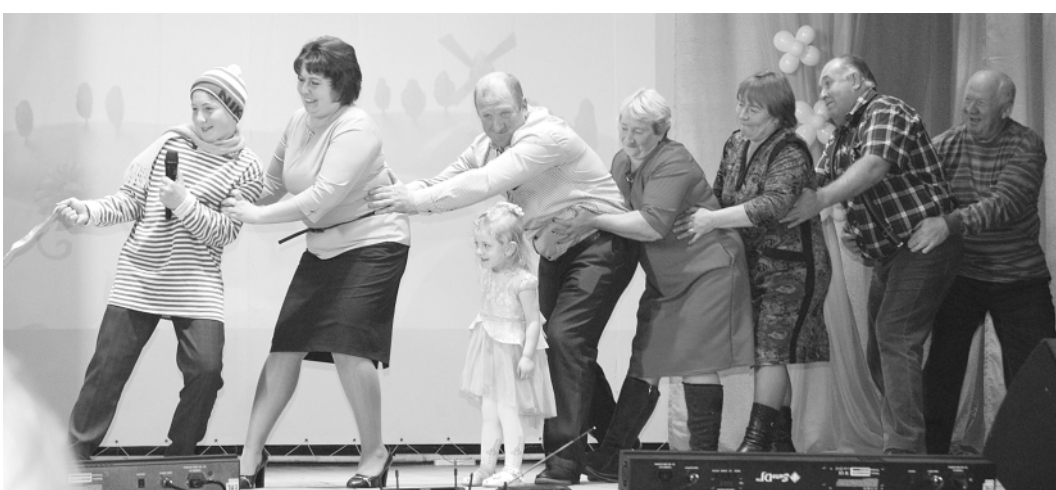
Поддержка родных значит очень много! Большая дружная семья Шнайдер из Зеленой Поляны на сцене вместе с бабушками и дедушками.