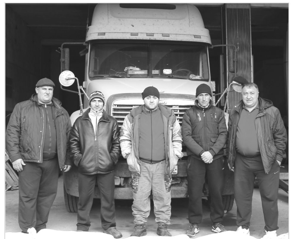
Команда Аветяна: кроме основной работы водителя каждый исполняет какую-то обязанность, один – моториста, другой – слесаря, третий – снабженца или заведует гаражом.

– Мелкий ремонт, техническое обслуживание, замену расходных материалов производим сами, а если вдруг случится крупная поломка, то отдаем агрегаты на диагностику в специализированные мастерские – «Дальнотбойщик», «АлтайСкания» и некоторые другие, так получается быстрее, надежнее и, в конечном счете, дешевле. Слава Богу, что за восемь лет работы в хозяйстве не случи-