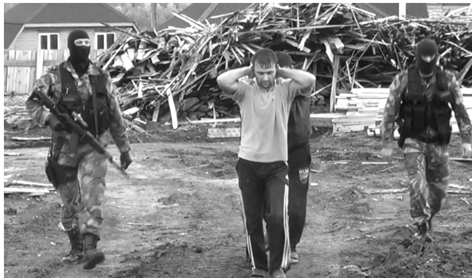
Огромное количество незаконно заготовленной древесины легализуется на стоящих в глуши лесопилках.

— Пилим мы сами, а не китайцы. Да, наш сосед готов принять огромный объем ресурса (20% всего китайского импорта древесины идет из России), и если у него есть возможность получить его даром, он будет этим пользоваться. Китай определяет спрос, но предложение формируется на нашей территории. Значит, нам надо организовать такой контроль, чтобы исключить саму возможность преступного предложения. Я, например, ни разу не слышал, как эшелон незаконной древесины про-