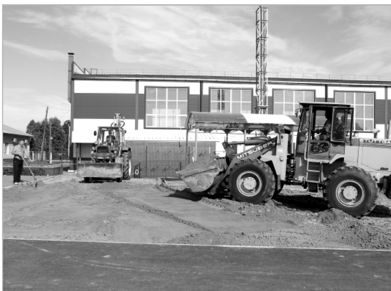
Несмотря на то, что работы по госпрограмме завершены и подрядчик сдал объект, администрация Троицкого сельсовета продолжает обустройство стадиона. Было принято решение облагородить прилегающую территорию за счет местного бюджета.

— Работами по возведению новых объектов занималось ООО «Сибирская строительная компания» из Барнаула, которое выиграло тендер, предложив наилучшие условия. Все работы были выполнены в срок и с хорошим качеством согласно проектно-сметной документации, которую подготовила специализированная проектная организация — ООО «Спортинвест». Стоимость всех работ составила 4 миллиона 79 тысяч рублей, средства мы получили из федерального и краевого бюджетов по государственной программе «Формирование комфортной городской среды» национального проекта «Жилье и городская среда». Основными целями программы являются благоустройство общественных территорий, повышение индекса качества городской среды, а также увеличение доли граждан, принимающих участие в решении вопросов развития городской среды. Эта программа очень выгодна для сельских поселений, ведь наше софинансирование — всего не более одного процента. Уже завершена строительством асфальтированная беговая дорожка вокруг футбольного поля, в том числе стометровка с резиново-полимерным покрытием. С таким же покрытием сделана волейбольная площадка, установлен под навесом уличные тренажеры, обустроена площадка для воркаута — это вид уличной гимнастики, которая может быть отнесена к любительскому виду спорта,