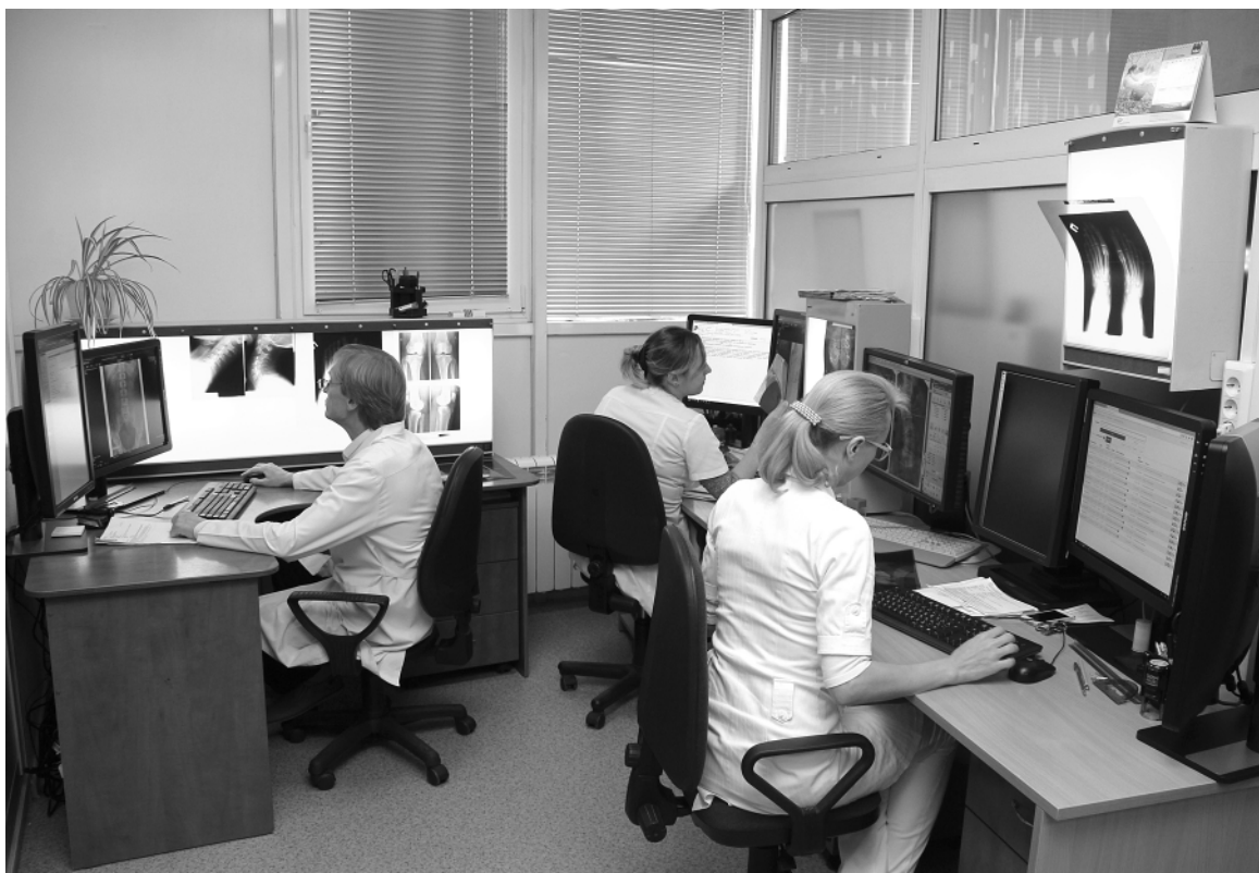
Удаленно следить за самочувствием пациентов помогает современная информационная система – Центр амбулаторного наблюдения за пациентами с коронавирусом.

Например, если в выходные дни в городах края не работают специалисты, расшифровывающие КТ-снимок, то изображение отправляется в Диагно-