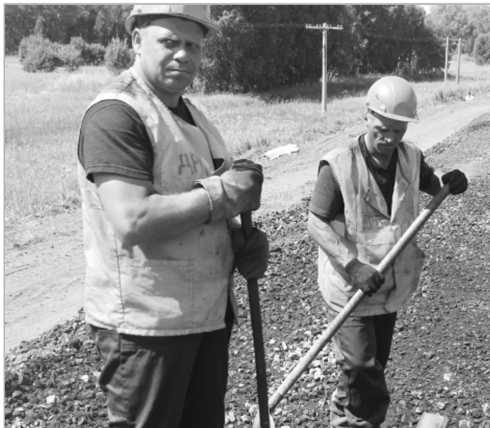
Этот труд не всякому по плечу.

Всего на объекте трудится около 50 человек различных рабочих специальностей, не считая машинистов и их помощников. Весь объем работ мы по плану должны закончить 1 октября и в этот же день забить «золотой» костыль на последнем стыке. Сегодня нам необходимо за несколько часов, до прохода поезда «Калина красная», завершить замену рельсов и шпал протяженностью 750 метров. Этот участок сложный, с подъемами и поворотами, на перегезде тяжелый грунт, тракторам очень трудно «вырезать» переезд, то есть убирать старый щебень, но должны успеть. Под ремонтом подразумеваются снятие решетки, то есть сборки рельсов длиной 25 метров со шпалами, выравнивание полотна и укладка новых решеток, но уже с железобетонными шпалами и новыми