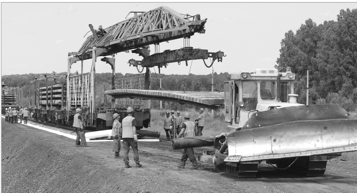
Как только железнодорожное полотно выровнено, путеукладчик укладывает новые, собранные в решетку рельсы вместе со шпалами.

рельсами. На последнем этапе, через несколько недель, на пути пойдет специальный железнодорожный состав, загруженный длинномерными рельсами по 650 метров, и будет проведена замена ныне уложенных рельсов на длинные, это будет бесстыковой, «бархатный» путь.