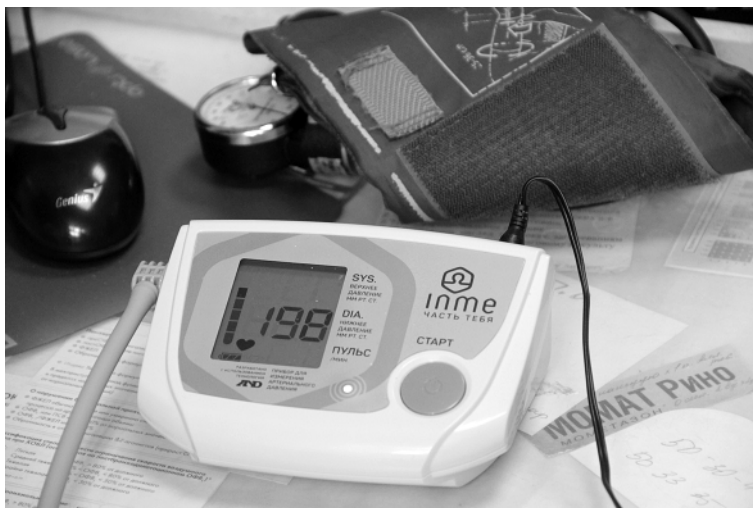
Благодаря тонометрам с SIM-картой и датчиком GPS за здоровьем пациентов с гипертонией врачи наблюдают удаленно.

стический центр Алтайского края и описывается его сотрудниками. Пока пациента везут из одной больницы в другую, доктор уже может посмотреть снимки и оценить состояние больного.