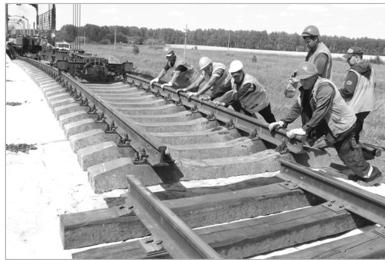
Несколько минут – и последний стык на этом участке будет сделан.

укладывает новые, собранные в решетку рельсы вместе со шпалами. Готовые сборки путеукладочный кран везет на специальных платформах за собой, по мере надобности он их протягивает, поднимает, переворачивает, укладывает на полотно, тут же по новым рельсам движется вперед, и процесс повторяется. Следом идут рабочие, закрепляют болты и гайки, специальными приборами проводят измерения. Завершает ремонт путей специальный поезд, из вагонов строго дозированно шпалы засыпаются щебнем, а следом движется вагон с вибратором, утрамбовывая свежий грунт.