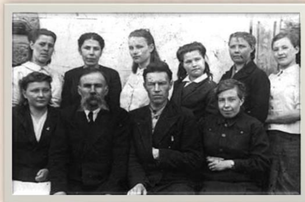
Персонал детдома с. Хайрюзовка, 1946 год

В октябре 1947 года детский дом закрыли, а детей и персонал перевели в Петровский детдом.