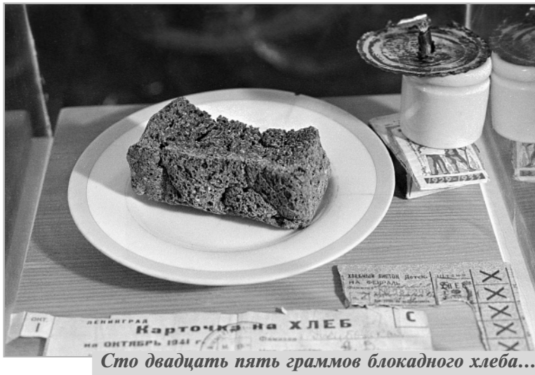
Сто двадцать пять граммов блокадного хлеба...

...Блокадный Ленинград — один из тех в истории массового голода примеров, когда случаи каннибализма не получили сколько-нибудь широкого распространения, какого можно было ожидать, если учитывать весь ужас положения миллионов людей. Да и сама протяженность во времени — 900 дней! Многие нам рассказывали, есть свидетельства в дневниках блокадников, что вот они сами, или их знакомые, или в очередях слышали: о людях в снегу с «обрезанными мягкими частями тела». О подозрительных белых холодцах, которыми торговали на рынке люди совсем не исхудавшие. О пропавших детях: мать только за-