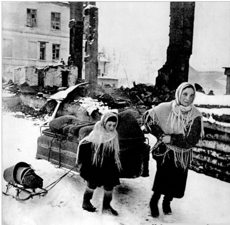
Надо искать новый кров...

...«Конечно, все приходилось есть: и ремни я ела, и клей я ела, и олифу: жарила на ней хлеб. Потом нам сказали, что из горчицы вкусные блины. За горчицей какая была очередь! Надо было уметь делать. Вот надо ее мочить семь дней, сливать воду и опять наливать, чтобы горечь вся вышла. Ну, конечно, я спекла блинчики, два. Съела один, и потом я стала кричать как сумасшедшая. У меня были такие