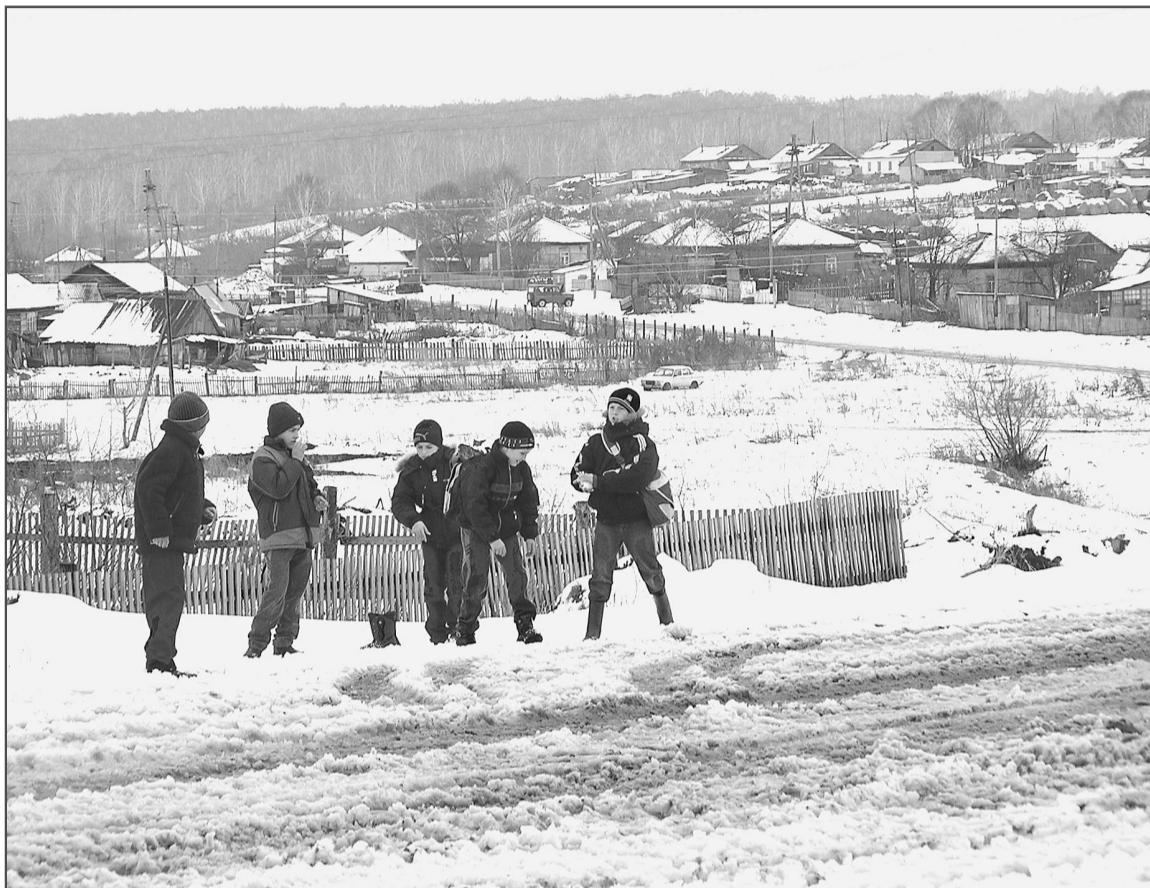
В Новоеловской школе 88 учеников, в том числе ребята из Гордеевки.

Конечно, если человек нигде не работает, то у него есть время вырастить и 30, и 40 свиней. Но проблемой становится приобретение кормов. Не работающему в сельхозпредприятии корма обычно обходятся дороже.