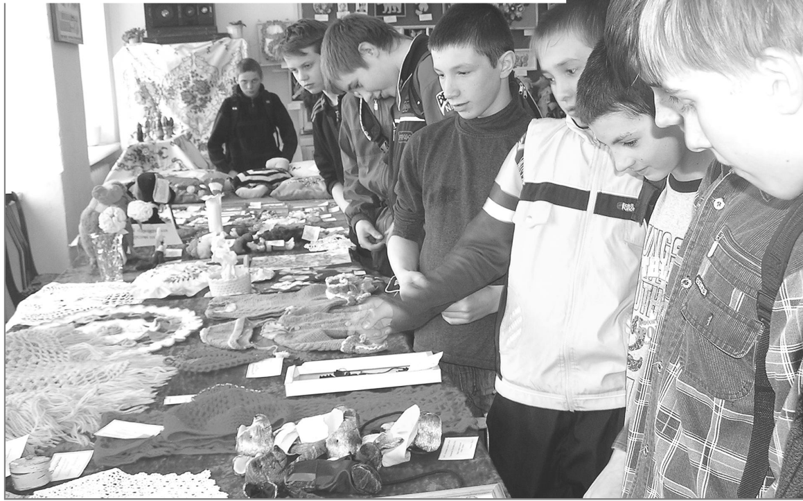
Входя в кабинет технологии, где располагалась выставка, учащиеся восхищались увиденным и с интересом рассматривали приглянувшиеся работы.

ПОДВЕДЕН ИТОГ районного этапа краевого детско-юношеского тематического конкурса, организованного ОГПС и комитетом по образованию, под названием