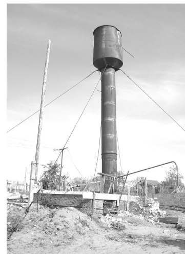
Водонапорная башня из Многоозерного послужит теперь боровлянцам.

Андрей ТИМОХИН.