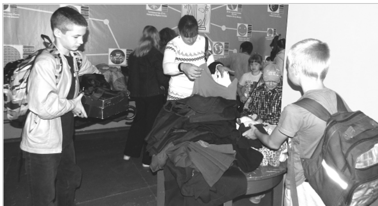
23 августа в помещении МДК прошла акция «Соберем детей в школу», которая ежегодно проводится в районе Комплексным центром социальной помощи.

Обращаясь к руководителям предприятий, организаций, предпринимателям, мы, конечно, надеемся на их участие. Но вместе с тем понимаем: сегодняшние экономические реалии таковы, что трудно всем. Кроме того, при поддержке предпринимателей проводятся многие районные мероприятия. И в связи с этим не всегда находят средства вновь участвовать в благотворительности.