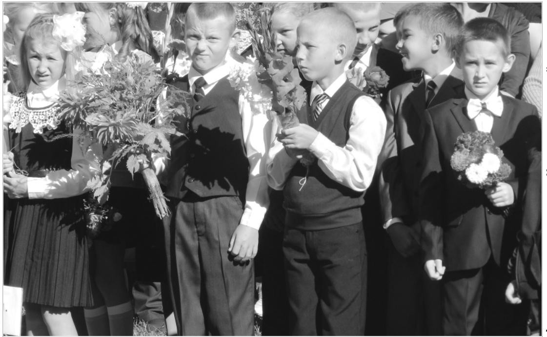
(1 сентября 2016 г. в Пролетарской СШ).

В октябре оценят качество предметного образования по географии в 7-х и 10-х классах, в период с 8 по 12 апреля 2019 года пройдут исследования по учебному предмету «Физическая культура». Всероссийские проверочные работы в штатном режиме напишут ученики 4-6 классов, для 7, 8 и 11-х классов их организуют в формате апробации. ВПР по иностранному языку в 11-х классах в обязательном порядке будет состоять из устной и письменной части.