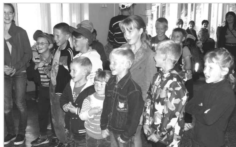
Во время акции ребята с удовольствием приняли участие в интересной игровой программе, которую подготовили и провели для них работники Дома культуры.

Ребята вместе с родителями пригласили в МДК, где работники культуры организовали для них игровую программу. Что же касается сел района, то мы работаем непосредственно с сельскими Со-