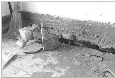
Разваливающийся тамбур красноярского ФАПа тянет за собой стену всего здания...

— Мы обслуживаем пациентов амбулаторно. Наш пункт в среднем принимает за день 15–20 пациентов, а в отдельные периоды, когда наблюдается подъем заболеваемости ОРВИ, доходит и до 50. ФАП обеспечен всем необходимым для качественного лечения больных, есть аптека, в которой согласно перечню имеется все нужное. Есть исправный автомобиль, но в ночное время, к сожалению, к заболевшим приходится добираться пешком, за исключением села Еремино, которое расположено на расстоянии семи километров. По плану раз в месяц село посещают и ведут прием специалисты центральной районной больницы — терапевт и