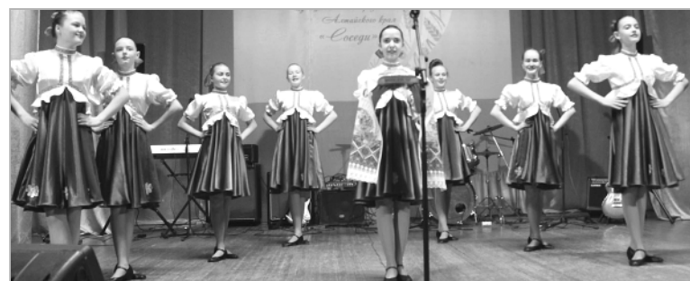
Хлебом-солью встречали наших артистов на гостеприимной красногорской земле.

Зрители тепло благодарили артистов за подаренное праздничное настроение.