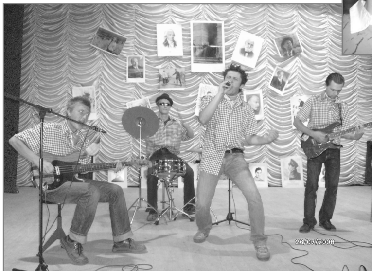
«Бомбуежище» поет о каннибализме.

В целом концерт прошел оригинально. В зале ДШИ, расцвеченном