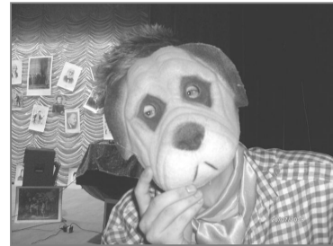
Грустная собачка не любит «Крысы», она любит «Заринский квас».

Сабельников и Сыроежкин: дискурс о вторичности завершен!