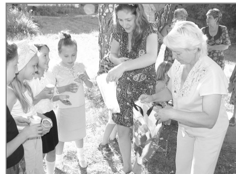
кими угощениями для юных конкурсантов.

— Совместно с родителями мы проводили различные концерты, выставки, чтобы не было скучно ни детям, ни взрослым, — говорит Ольга Николаевна. — В конкурсах принимают участие дети от четырех до одиннадцати лет. Каждый из них придумывает что-то свое, оригинальное, даже стихи сочиняют. А взрослые накрывают стол со слад-